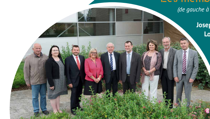
Les membres du Bureau (de gauche à droite)

Depuis 2014, l'ensemble des collectivités d'Ille-et-Vilaine adhèrent au Centre de Gestion. Toutes membres de cette coopération spécialisée en RH, elles font le choix d'un groupement de moyens au niveau départemental, nécessaire pour les relations avec les partenaires (caisses de retraite, fonds handicap, mutuelles, assurances...) et pour la constitution d'une pépinière de candidats préparés aux postes à renouveler (concours, remplacements, recrutements).