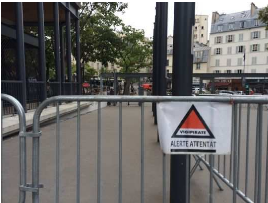
Université Pierre-et-Marie-Curie, métro Jussieu, à Paris, le 6 septembre 2016.

LE MONDE | 01.12.2016 à 12h00 • Mis à jour le 01.12.2016 à 14h40